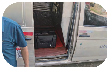
专业的物流运输师傅，专车直达细胞药回输实验室（100-2000 公里）