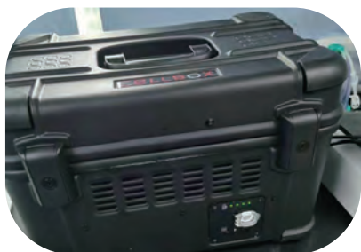
无需购买 Cellbox 2.0 运输箱，可直接采用 Cellbox 细胞药运输服务

服务提供完善的细胞药运输参数清单，妥善的样本固定，稳定的孵育温控（28-38°C）、二氧化碳浓度（0-18%），支持在线监控数据和车载充电，尽可能将细胞药物以高活性的状态，安全且快捷地运送到细胞药实验室，甚至能在运输过程中培养扩增的细胞药物。